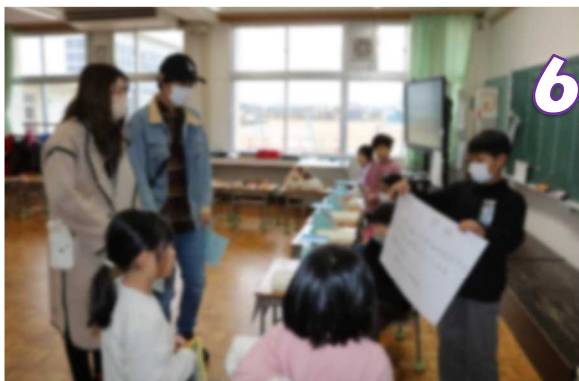
6班 1Kg を当てろ