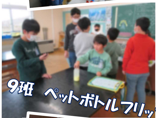
9班 ペットボトルフリップ