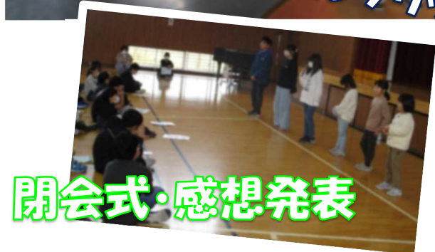
閉会式・感想発表