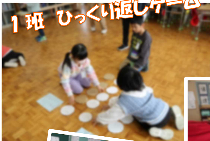
1班 ひっくり返しゲーム